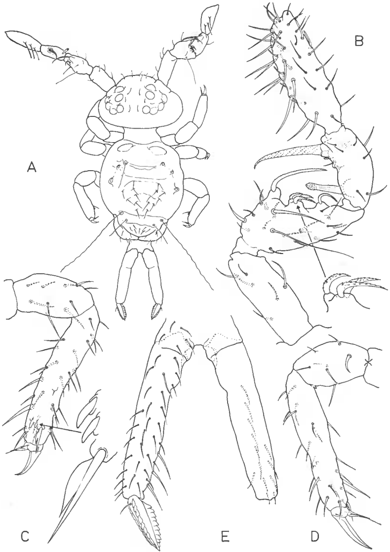
FIG. 3. — Sminthurides monnioti n. sp. ♂.

individu au premier stade. Les trichobothries du petit abdominal rappellent également, par leur longueur, celles des individus de 1 er stade. Mais, alors qu'au premier stade, il n'existe pas de trichobothrie sur le grand abdominal, notre exemplaire ♂ en présente 3 paires sensiblement en ligne (fig. 3, A).